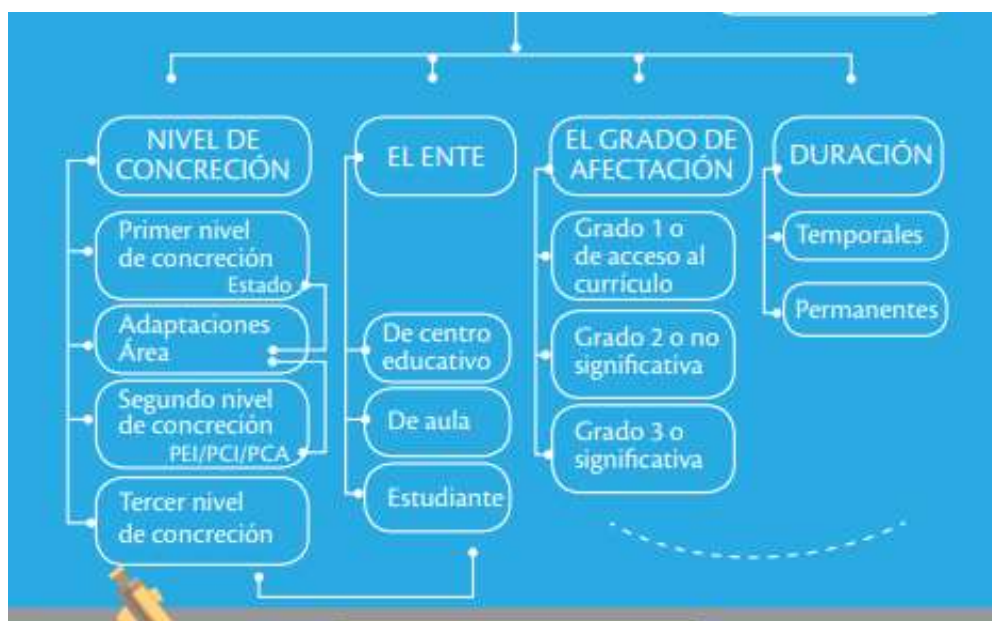
Ilustración 1: Características de las adaptaciones curriculares

Según la guía de trabajo de Adaptaciones Curriculares Mineduc (2017), para la educación especial e inclusiva, pueden ser clasificadas tomando en cuenta las siguientes características: