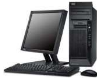
Computadora de escritorio