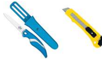
Figura 6. Utensilios de corte