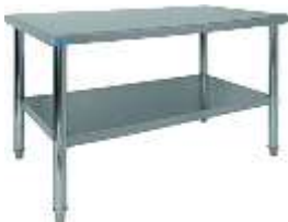
Figura 9. Mesas de trabajo

Es importante mencionar que, si bien la empresa no se dedicará a la fabricación de mallas, resulta imprescindible disponer de insumos y herramientas para su elaboración en caso de realizar ajustes a cada artículo cumpliendo así las expectativas del cliente.