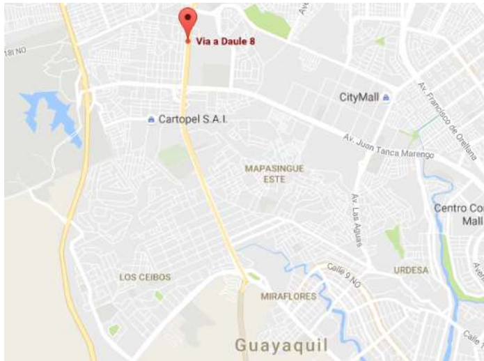
Figura 3. Ubicación de la empresa

Respecto a la distribución del establecimiento, el mismo está compuesto de dos áreas que son la administrativa y la operativa. En la parte administrativa constará el equipo de ventas y gerencia mientras que en la operativa se encontrará el área de logística, encargándose de la adquisición de las mallas, control de calidad y distribución hacia los clientes