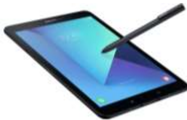
Tablet para vendedores (excluye gerencia y operaciones)