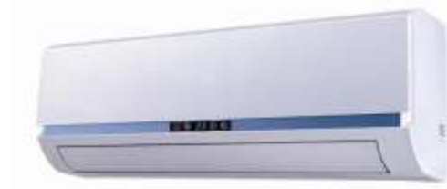
Acondicionadores de aire tipo split