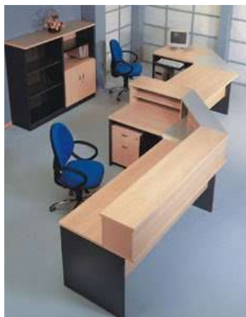
Muebles y enseres