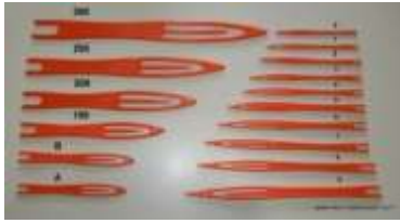
Figura 5. Agujas para tejer redes