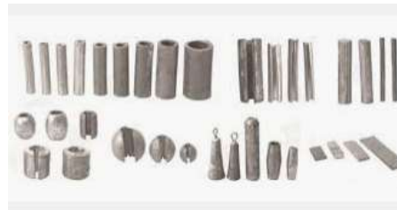
Figura 8. Plomo para atarraya