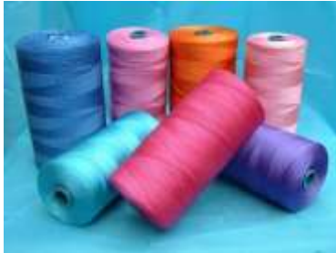
Figura 7. Nylon Fishing Twine