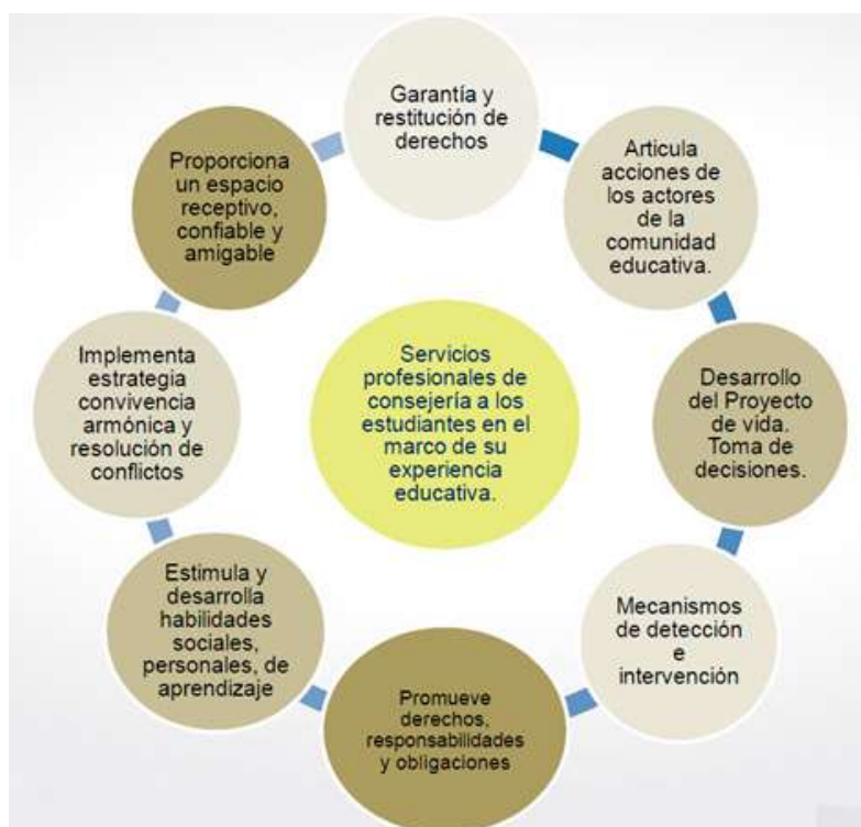
Gráfico 1: Funciones del Departamento de consejería Estudiantil