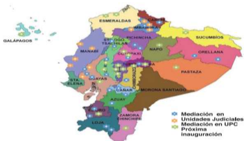
Figura 1. Centros de mediación

El actuar formula listas de mediadores y requisitos, tarifas de designación, descripción del manejo administrativo y Código de ética institucional.