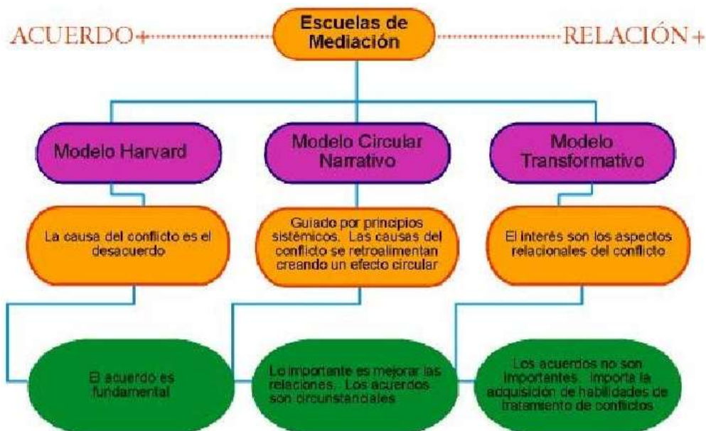
Figura 2. Modelos de mediación: Harvard, Transformativo y Narrativo