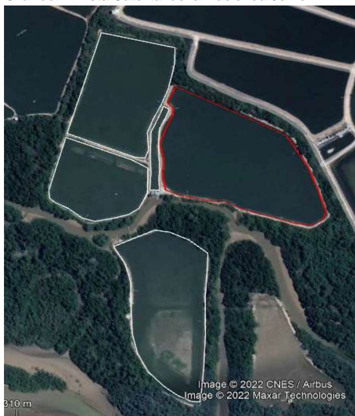
Gráfico 1. Vista Satelital de la Hacienda Jervez.

La hacienda geográficamente presenta la siguiente ubicación, Latitud: 3°24'22.92"S y Longitud: 79°59'42.54"O