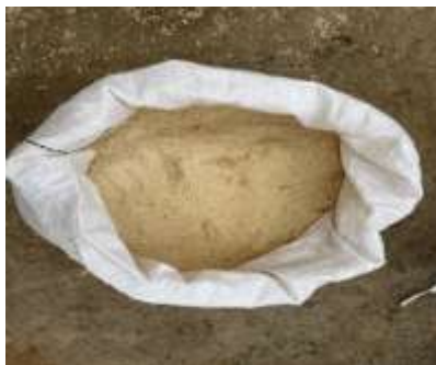
Gráfico 5. Salvado de arroz