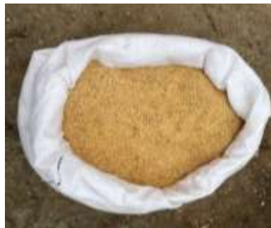
Gráfico 4. Salvado de Soya