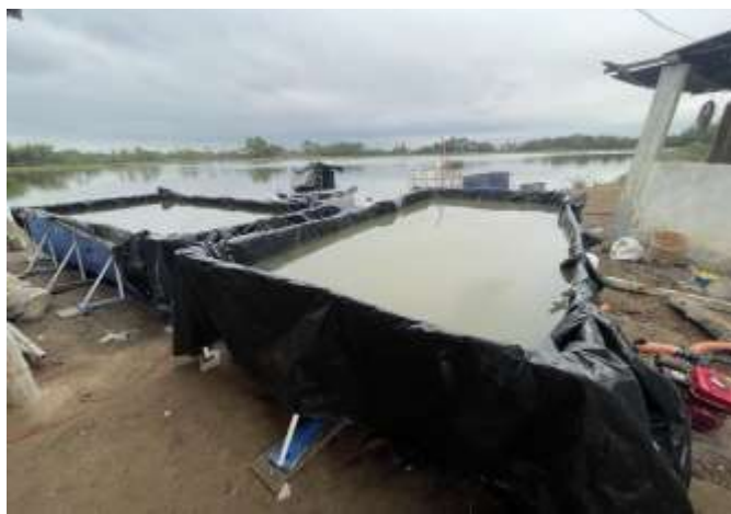
Gráfico 3. Lugar objeto de estudio