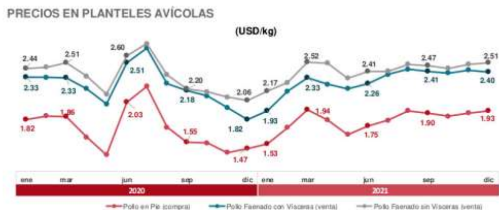
Figura 1 Precio en dólares por Kg de pollo

En el periodo de producción avícola del 2020 se vio afectado de forma considerable el precio llegando hasta menos de 1,5 usd. por Kg para los pollos en pie, dichos valores se mantuvieron durante el periodo de abril 2020 hasta la fecha de enero del 2021, ocasionando que los productores de las granjas avícola pertenecientes al proyecto fuesen afectados de manera negativa en sus registros de ingresos, inclusive algunas de las granjas se vieron tan afectadas en su producción que llegaron a tener que sacrificar aves o en su defecto tuvieron que cerrar definitivamente las granjas.