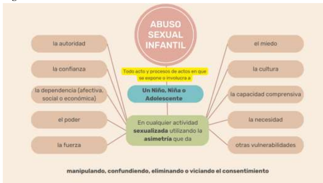
Figura 1 Abuso Sexual Infantil

Nota: esta grafica organiza la cita de (Berlinerblau, 2016).