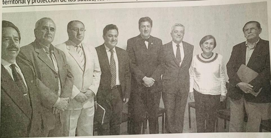
Andrés León M. - Redacción Ecotel Press - Loja - Ecuador

Con interrogantes sobre eliminar la burocracia y tramitología en los servicios, deuda municipal, planes de ordenamientos territorial y protección de los suelos, les tomaron la prueba a las propuesta de los aspirantes al Municipio.