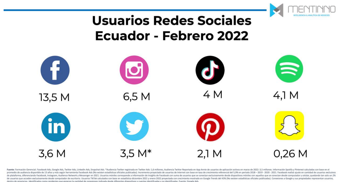
GRÁFICO 1 USUARIO DE REDES SOCIALES

Los medios de comunicación en la actualidad se han convertido en mediadores entre la sociedad y los políticos o de aquellos que están en el poder, creándose una profunda brecha informativa, donde el rol de los medios de comunicación es más destacado y valorado entre los ciudadanos.